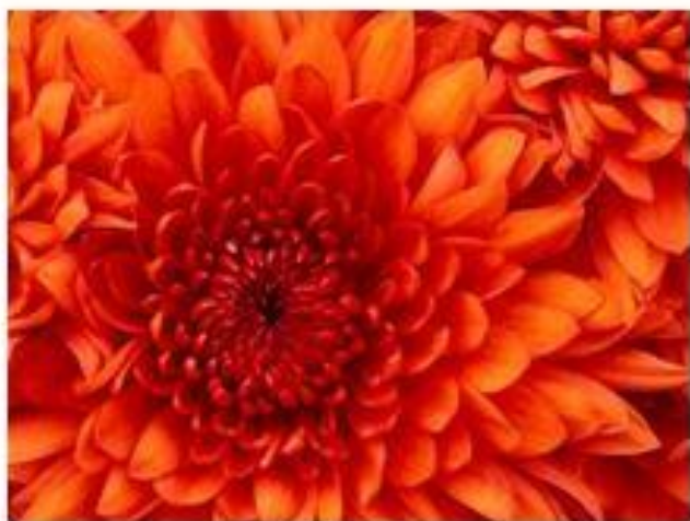
1 pav. Gėlė