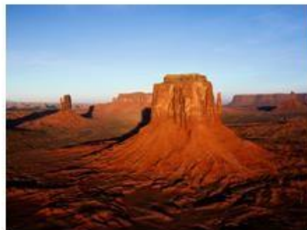
2 pav. Dykuma